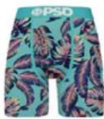
PALM SPRINGS MM