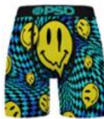
RAVE SMILES MM