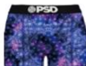
BNDN DEEP DYE