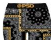
RICH BNDN BLACK