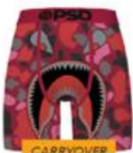
WF RED PUNCH