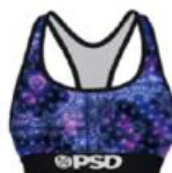
BNDN DEEP DYE