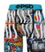
MONEY ON MY MIND