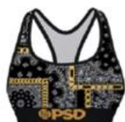
RICH BNDN BLACK