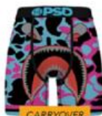
WF VICE CITY