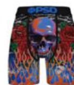
ROSE N BONES