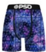
DEEP DYE MM