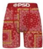
RICH BNDN RED