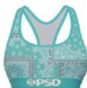
RICH BNDN TEAL