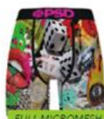
CURRENT MOOD MM