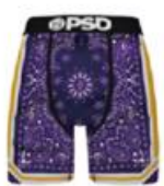
BALLER BNDN LA