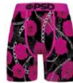
NEON PINK ROSE