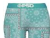
RICH BNDN TEAL