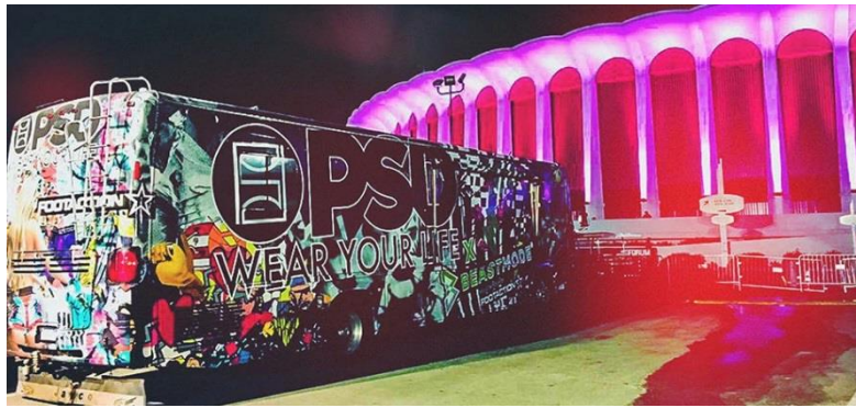
フレンツ兄弟がペイントして全米を旅した RV

PSD は、様々なライフスタイルに合うパーフェクトなアスレジャー・アンダーウェアを開発しました。アスリートでなくてもデザインと快適性を重視して多くの人々に選ばれています。バスケットボールやフットボールなどアクティブにスポーツをする人は、コンプレッションショーツの代わりに PSD を履いてプレーできます。PSD は単なるアンダーウェアではなく、機能性も兼ね備えたアンダーウェアでもあるのです。