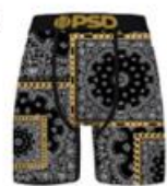
RICH BNDN BLACK