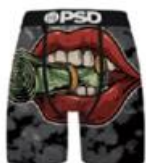
BLUNT MONEY MM