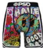
HAVE A GOOD DAY