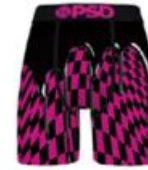
NEON PINK DRIP