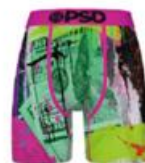
NEON PINK BILL